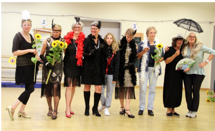
Das hauptamtliche Team singt den Ehrenamtlichen ein „Dankeschön“!

Eigentlich wollten wir 2020 die 20er hochleben lassen, nun wurde es eben 2022. Es war Wochenende und leider kein Sonnenschein. Endlich mal wieder Zeit nicht nur „Danke“ zu sagen, sondern gemeinsam es richtig „krachen“ zu lassen. Normalerweise feiern wir einmal im Jahr ein großes Dankesfest für die tolle Unterstützung der unentbehrlichen ehrenamtlichen Mitarbeiter:innen. Doch das ist in den letzten Jahren deutlich zu kurz gekommen. Dabei ist gerade jetzt die ehrenamtliche Unterstützung eine ganz enorme Erleichterung.