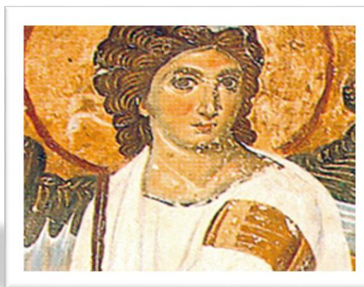
„Engel auf dem Grabe Christi“ (14. Jh.) Kloster Mileseva

Spendenkonto "Gabriel": Förde Sparkasse Kiel IBAN: DE45 2105 0170 0100 0485 45 BIC: NOLADE21KIE Gläubiger-Identifikation: DE05ZZZ00001043793